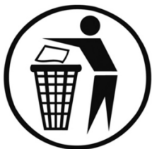
Aufkleber für Abfallbehälter -Saubermännchen- ø 205 mm