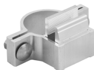
Alform-Klemmschellen ausschließlich für Alform-VZ