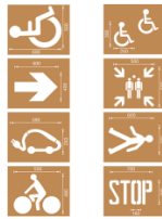
Spritzschablonen für Bodenmarkierung, Satz 11 (Stop and Go), Inhalt 8 Schablonen