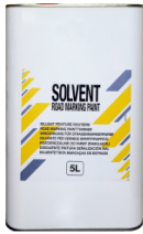
Verdünnungsmittel -Traffic Paint-