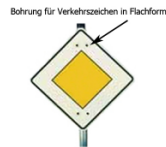
Bohrung für Verkehrszeichen in Flachform