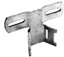
Bandschellen für Flach-VZ