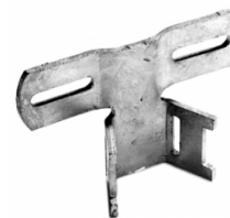
Bandschellen für Flach-VZ