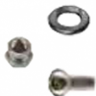
Befestigungsschraube inkl. Mutter und Unterlegscheibe