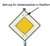
Bohrung für Verkehrszeichen in Flachform